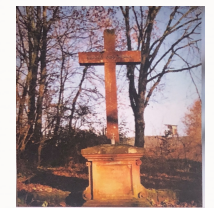
Kreuz am Schlawweg