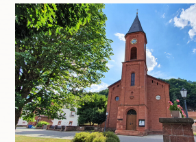
Kirche Heilig Kreuz

Den Schlawweg (Bergstraße) hinab geht's zur Dorfmitte wo die Kirche Heilig Kreuz steht. Gegenüber steht im Ruhepark das Kriegsgefallenen Denkmal. Die letzte Etappe geht durch die Wiesenstraße zur Freizeitanlage. Hier kann man sich noch etwas verweilen. Für den kleinen Hunger ist nebenan ein kleines Freiluftcafe das sich ebenfalls als Ausklang gut anbietet.