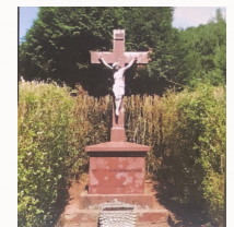
Kreuz im Matzental