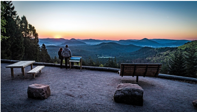
Schöne Aussicht am Eyberg